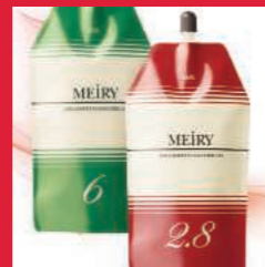
メイリーオキシダイザー エマルジョンタイプ 6% / 2.8% 染毛補助剤過酸化水素 第2剤 内容量 1,100mL 医薬部外品 美容室専用