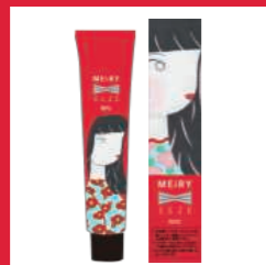
メイリーセゼクロス 酸化染毛剤 第1剤/全12色 内容量 90g 医薬部外品 美容室専用