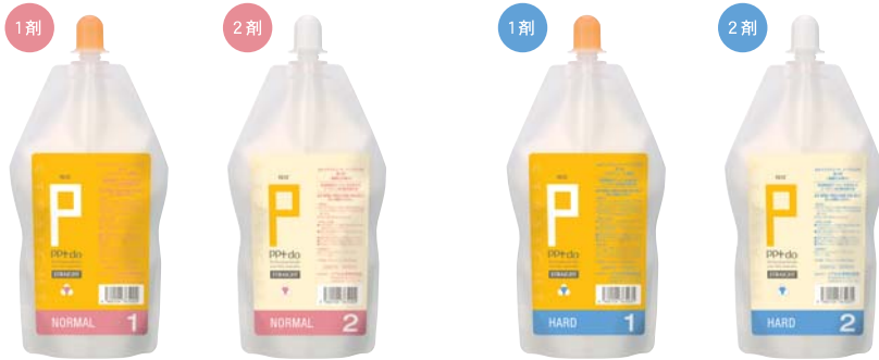
pptドゥストレート ノーマル [N] 第1剤・第2剤 内容量 各400g

高温整髪用アイロン使用で主に縮毛矯正新生部の弱いくせ毛に対応 [医薬部外品][美容室専用]